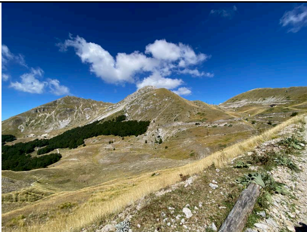
Monte Terminillo e Rifugio Sebastiani

COSTI: Soci CAI € 3 - Non soci € 12. MODALITÀ: l'iscrizione va effettuata obbligatoriamente entro venerdì 5 luglio via email a slowbike@caiascoli.it oppure recandosi presso la sede CAI in Via Cellini 10 (aperta il venerdì dalle 18:30 alle 20). I non soci CAI potranno iscriversi all'escursione esclusivamente recandosi in sede. ISCRIZIONE: Per partecipare alle iniziative SlowBike, occorre consultare il Regolamento Escursioni, disponibile sia in sede CAI sia su www.slowbikeap.it